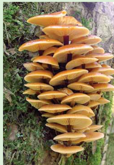
Penízovka sametonohá může být zajímavým zpestřením bramborového salátu

Při procházce lesem možná narazíte také na takzvanou královnu zimy, kterou je penízovka sametonohá. Jak napovídá název, poznáte ji podle sametově chlupatého, u starších plodnic až černo-hnědého třeně. Její výrazné žluté kloboučky zpestří váš bramborový salát. Nasbírané plodnice očistěte a dejte na deset minut do vlažné vody. Kdo chce, může je následně chvíli povařit. Výhodou však je, že je lze konzumovat i zasyrova, tudíž je lze hned nadrobno nasekat a zamíchat do salátu.