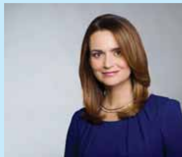
Moderátorka Daniela Písařovicová

Moderátorka Daniela Písařovicová se narodila 12. prosince 1978 ve Znojmě. Vyrůstala v Jaroměřicích nad Rokytnou, kde snila o povolání učitelky a chvíli i o korunce krásy. Během studia na znojmském rakouském gymnáziu se proto zúčastnila několika soutěží krásy, včetně Miss ČR v roce 1997. Záhy ale pověsila modeling na hřebík a vystudovala zahraniční obchod, diplomacii a mezinárodní vztahy na VŠE. V roce 2004 nastoupila do zpravodajství České televize, kde postupně moderovala Studio ČT24 či Interview ČT24. Finalistku loňského ročníku StarDance Danielu Písařovicovou mohou diváci v současné době vidět na televizních obrazovkách v pořadu Události a Události, komentáře či na jevišti Divadla na Vinohradech v inscenaci Návštěva staré dámy.