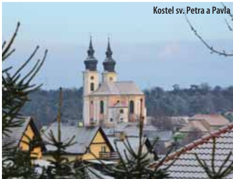
Kostel sv. Petra a Pavla