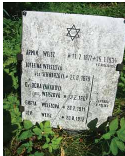
Náhrobek Weiszových, Židovský hřbitov, České Budějovice