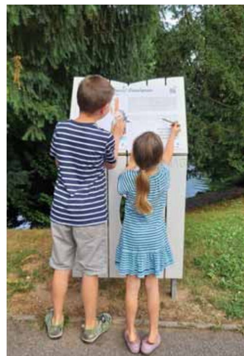
Mláďa na Stezce spisovatelů