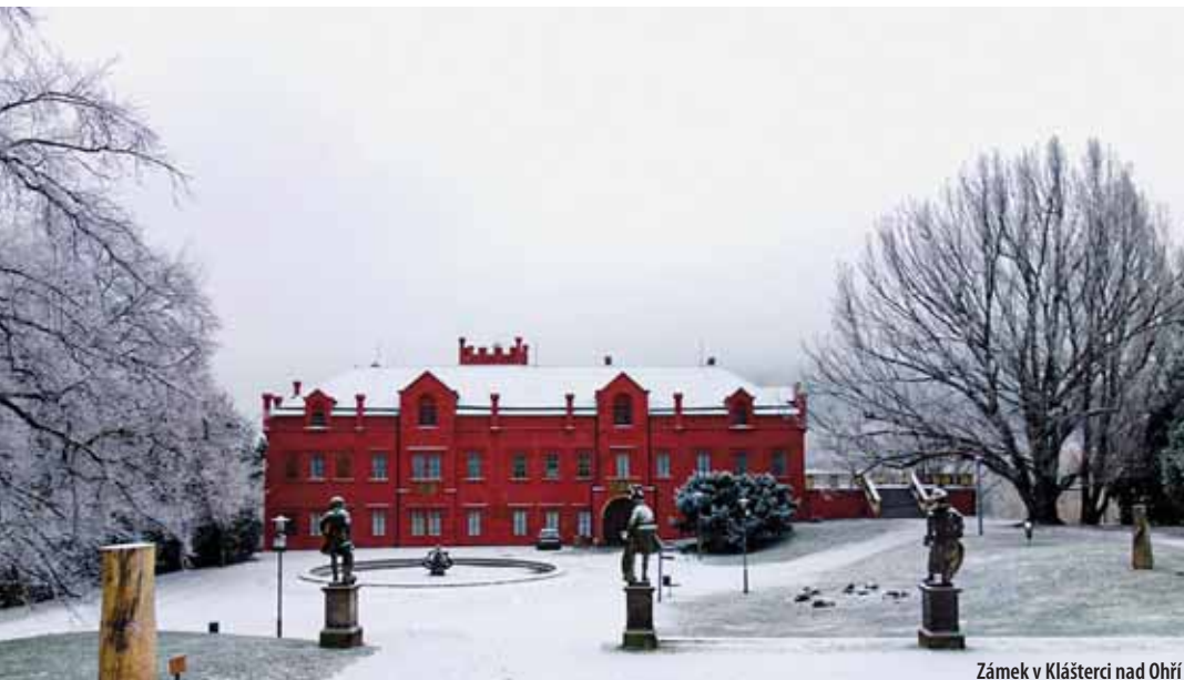
Zámek v Klášterci nad Ohří

centračním táboře Bergen-Belsen a výstava, která se protáhne přes dva po sobě jdoucí roky a končí až 31. ledna 2020, má tak připomínat také 75. výročí jeho smrti.