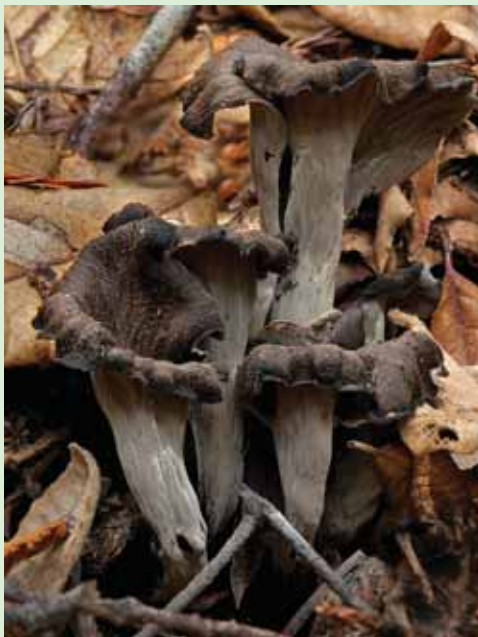
Tradiční černý kuba se připravoval ze stročků, díky kterým byl opravdu tmavý

Odkud se vzala jeho tradice? Hledat bychom měli u starých Slovanů, kteří měli houby v úctě