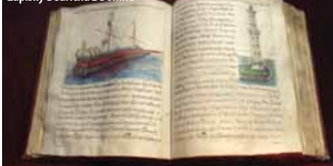
Zápisky Bedřicha z Donína

Určitě na Šumavu. Nedávno jsem tam totiž v okolí Borových Lad absolvovala dvě nádherné patnáctikilometrové pěší trasy. V létě jsem se na pár dní