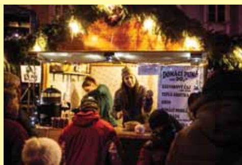
Vánoční trhy ve městě