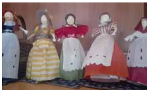
Letošní hlavní novinkou na Hradecku je Muzeum hraček Stuchlíkovi v Novém Bydžově

Ubytování bylo připraveno v Apartmánech u Novačky v Lubně nedaleko Nechanic. Stylové prostředí statku dokresluje Muzeum pod hvězdami, které je volně přístupné a jeho expozice se tematicky obměňuje podle ročních období. Spolek Vejměnek má certifikaci na specifické služby v cestovním ruchu, protože kromě uvedeného se dvakrát ročně stará o provoz kavárny v prostorách zámecké kuchyně na zámku Hrádek u Nechanic, kde během vánočního a velikonočního období můžete ochutnat výrobky regionálních producentů i domácí výroby.