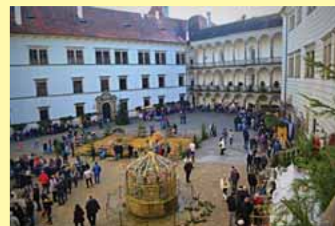
Adventní trhy na zámku