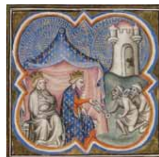
Richard Lví srdce a Filip II. přijímají kapitulaci Akkonu