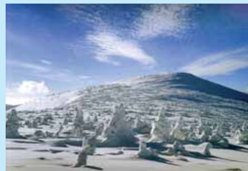
Zasněžené kopce Krkonoš