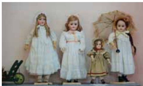
V Ateliéru Chaloupka v Třebechovicích pod Orebem se vyrábí například zajímavé krepanenky

Destinační management Hradecko uspořádal press trip s tématem Regionální produkt Hradecko, kde byly odprezentovány vybrané regionální produkty. Bylo opravdu o co stát, jednalo se o exkurze u nadšenců, kteří se mohou pyšnit tímto označením a předvedli nám, že jejich činnost či výrobky jsou vsutku originální.