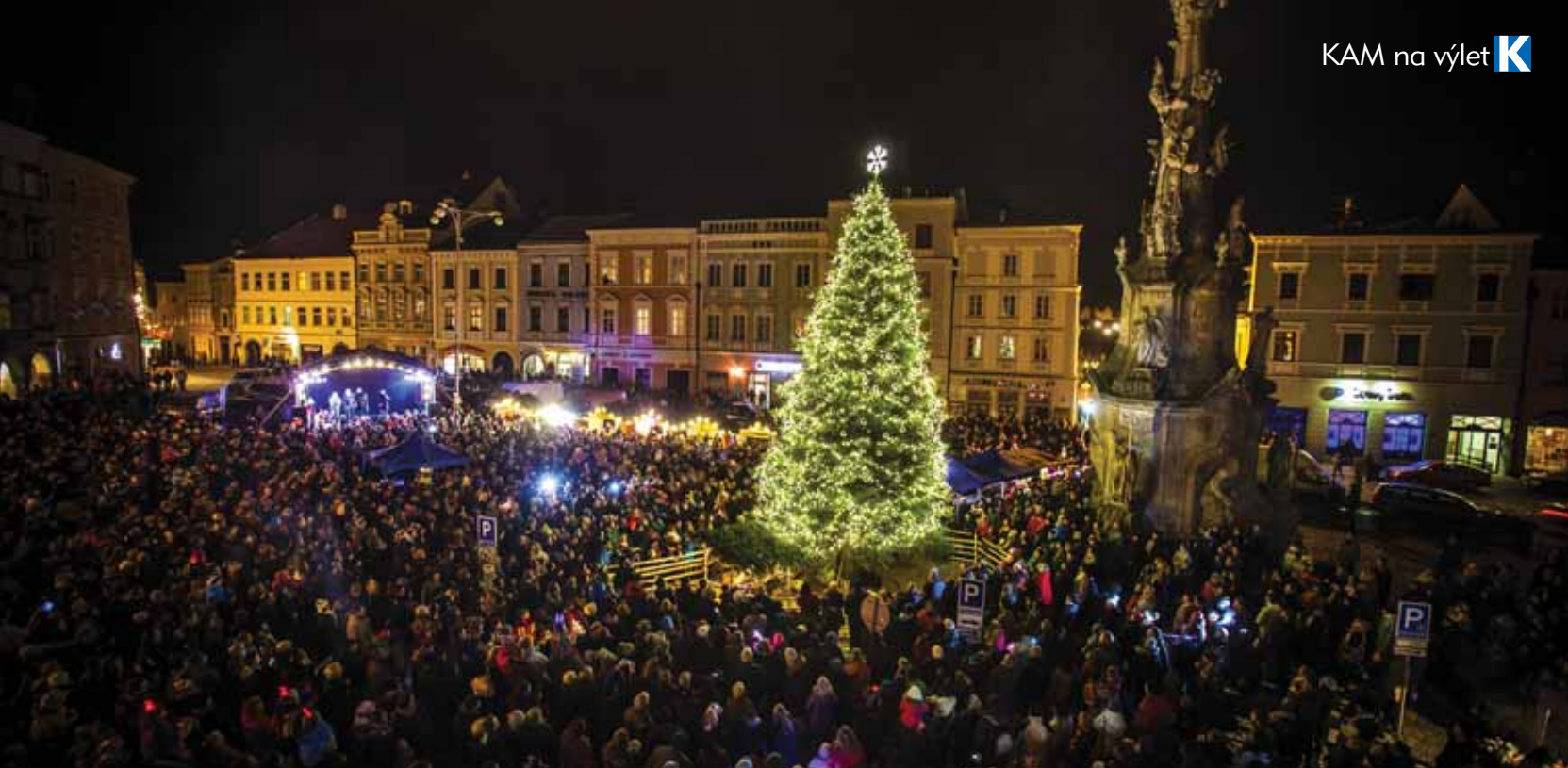
Rozsvěcení vánočního stromu