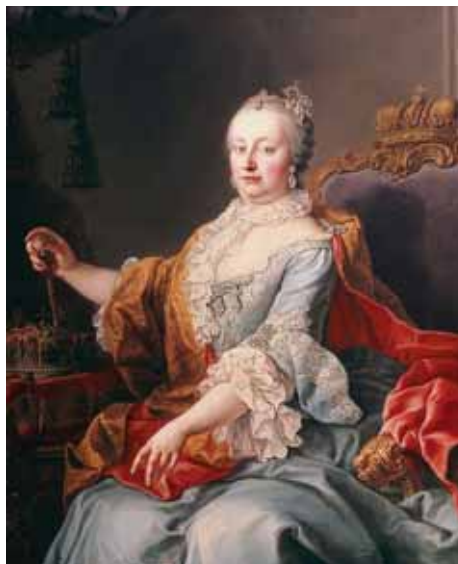
Císařovna Maria Theresa, portrét Martina van Meytense (1759)