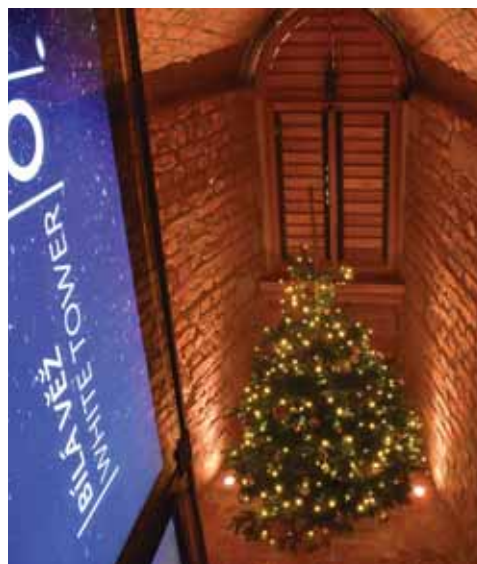
Bílá věž vánoční, Hradec Králové