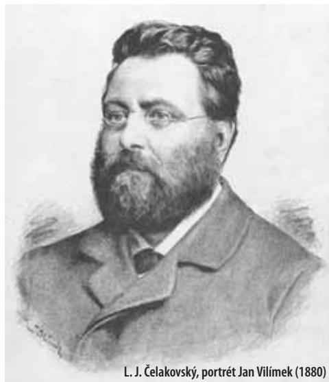
L. J. Čelakovský, portrét Jan Vilímek (1880)

Jeho nejvýznamnějším botanickým dílem je Prodrómus květeny české (1868–1883), vydaný