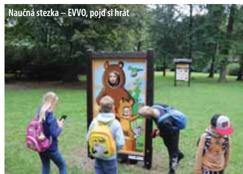
Naučná stezka – EVVO, pojď si hrát

02. 11. | Gala program k 60. výročí dětského folklórního souboru Vscánek