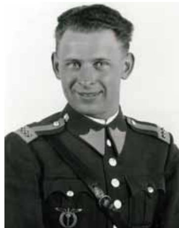
V hodnosti četaře, druhá pol. 30. let

V letech 1927–1935 absolvoval vojenskou školu letectva, základní vojenskou službu u letectva, stíhací výcvik a kurz létání v noci. V letech 1933–37 působil jako vojenský zkušební pilot a poté jako civilní pilot ČSA (1937–39). Po okupaci odešel přes Polsko do Francie, kde 11. 10. 1939 vstoupil do cizinecké legie. 1. prosince se stal členem francouzského vojenského letectva a od května 1940 byl instruktorem létání. Po kapitulaci Francie odplul do Anglie 23. 6., kde vstoupil do RAF u 311. čs. bombardovací peruti jako instruktor létání. Po splnění turnusu v červenci 1943 byl přeložen k 24. dopravní peruti, v dubnu 1945 k 147. dopravní peruti a koncem května 1945