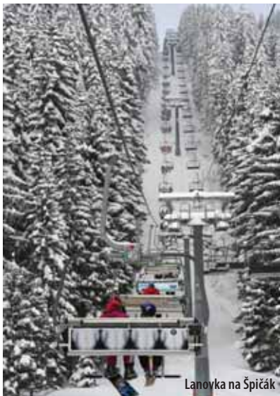
Lanovka na Špičák

V Železné Rudě je několik lyžařských areálů. Krásným místem jsou Samoty Železná Ruda. Tento areál se nachází v centru Železné Rudy a je zaměřen především na rodiny s dětmi. Dalším areálem je areál Nad nádražím, který je přes vrchol propojen