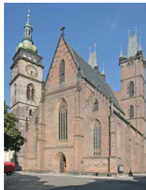
Katedrála svatého Ducha, Hradec Králové