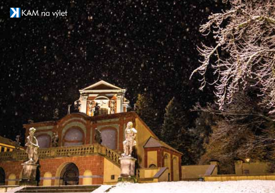
Park v zimě