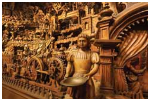
Třebechovické muzeum betlémů