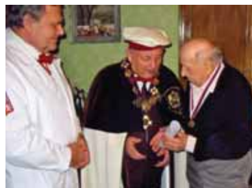
Ocenění Společenstva cukrářů České republiky za celoživotní práci (2004)