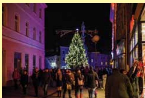
Vánoční centrum města

Podrobný adventní program: Infocentrum Jindřichův Hradec www.infocentrum.jh.cz