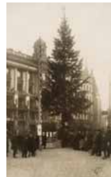
Strom republiky v Brně (1924)