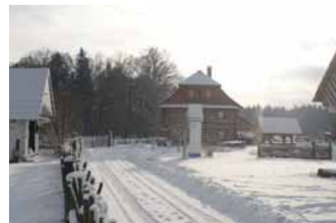
Podorlický skanzen Krňovice