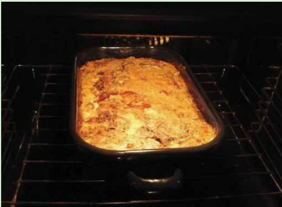
Houbovec je tradičním vánočním jídelm krkonošských horalů