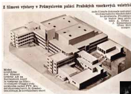
Model prvních budov studií, 1932

Jeho příjmení známe všichni díky našemu prvnímu posttotalitnímu prezidentovi Václavu Havlovi, synovci Miloše Havla. Miloš se narodil v Praze do rodiny stavitele Václava Havla, který postavil palác Lucerna na Václavském náměstí. Tak započal éru rodinného podniku Lucernafilm, ve kterém Miloš pokračoval. Milošův bratr Václav se zasadil o projekt na Barrandově, tehdy velmi klidném místě na okraji Prahy, kde postupně vznikly filmové ateliéry pro výrobu filmů Lucerna. Aby si Miloš v době okupace svou pozici udržel, musel s německými okupačními úřady