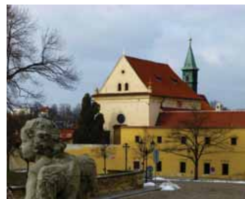
Kostel Panny Marie Andělské v Praze na Hradčanech