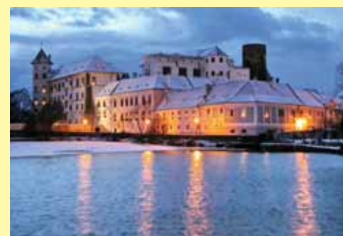
Státní hrad a zámek Jindřichův Hradec

7. a 8. prosince , tedy o druhém adventním víkendu vás zveme k návštěvě tradičních Adventních dnů na zámku a vánočních trhů ve městě, které se konají na druhém a třetím zámeckém nádvoří. Návštěvníci pravidelní i noví se mohou těšit na tržiště s originálním zbožím a také se sladkými i slanými pochutinami. Program obou víkendových dnů nabídne hudební, taneční a divadelní vystoupení. Nejen dětské návštěvníky jistě potěší malý zvěřinec, výstava sokolnických cvičených dravých ptáků nebo lukostřelba na druhém nádvoří. V provozu bude opět 500 let stará černá kuchyně. Své dovednosti předvedou umělci řezbáři, kováři a hrnčíři a v malých tvůrčích dílnách budou zájemci moci vyzkoušet svou vlastní zručnost. V rámci Adventních dnů mohou návštěvníci zavítat také do Domu gobelínů , kde si budou moci prohlédnout ukázky řemesel, a připravena bude také dílna pro děti i dospělé. Za návštěvu stojí i expozice Výstavního domu Stará radnice .