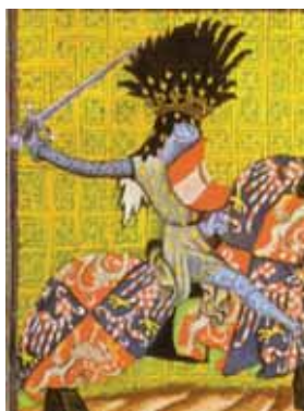
Přemysl Otakar II., Gelnhausenův kodex

Prusové byli poraženi koncem roku v bitvě u Rudavy na zamrzlých močálech Sambijského poloostrova. Od biskupa Bruna ze Schauenburka přijali křest a na památku výpravy byl v únoru 1255 založen Přemyslem hrad nad řekou Pregolou (Královec, Königsberg, Kaliningrad). Přemyslovci si zajistili silný vliv ve Slezsku a v Polsku, ale udělat z olomouckého biskupství arcibiskupství, spravující získaná území, se jim nepodařilo.