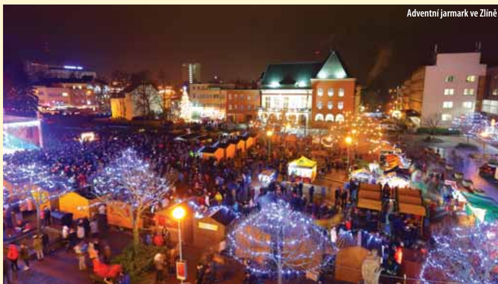
Adventní jarmark ve Zlíně