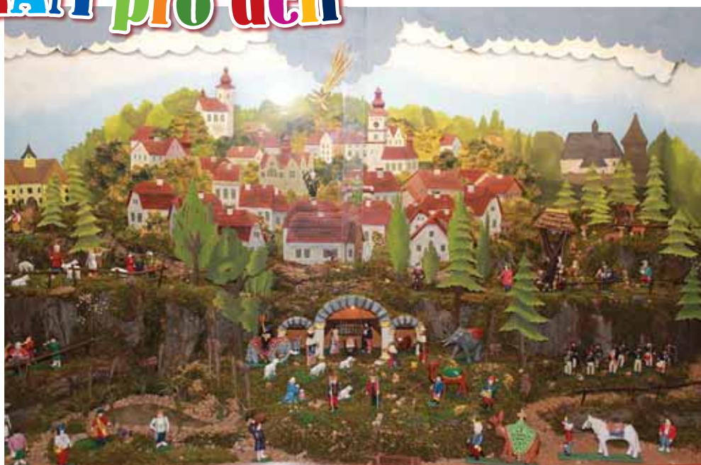
Muzeum hraček Stuchlíkovi