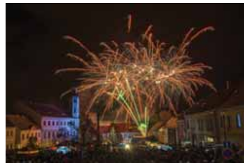
Ohňostroj při rozsvícení vánočního stromu

V prosinci začíná třetí výstava ze série Osudových devítek. Tou první byla výstava věnovaná roku 1939, začátku druhé světové války a vzniku Protektorátu Čechy a Morava, druhá výstava připomíná výročí roku 1989 a právě v adventním čase, konkrétně 13. prosince, bude zahájena třetí výstava, která bude zaměřena na tvorbu Josefa Čapka s názvem Josef Čapek – grafika.