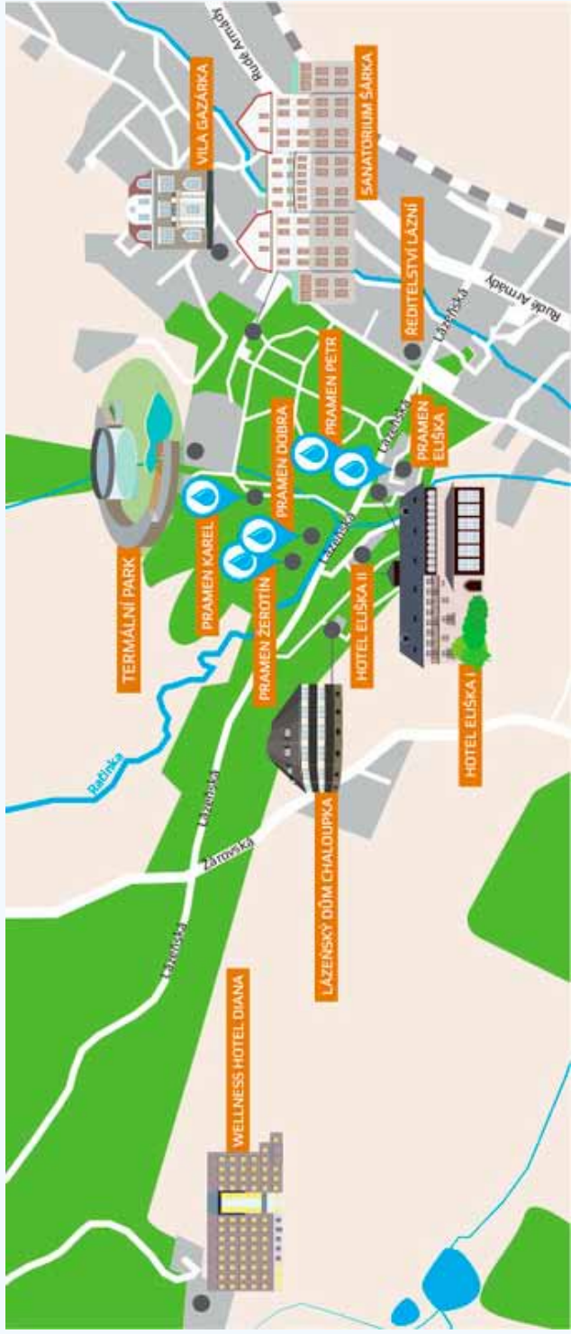
Ne všechna zřídla je možné navštívit, jsou zakonzervovány v zemi, napájí bazény. Pitný je pouze pramen Karel - altánek v parku.