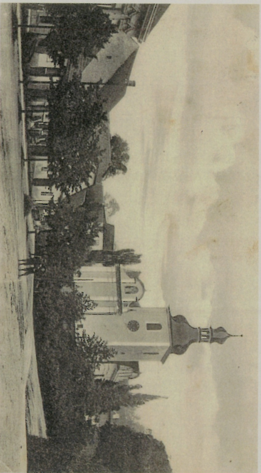
Zbiroh na počátku 20. století

Knížecí rod obýval zámek zpočátku jen občas, teprve od roku 1913 trvale. Na začátku 2. světové války museli zámek uvolnit německé jednotce. Od roku 1945 byl zámek státním majetkem a téměř 60 let ho užívala armáda. Po roce 1990 byl v restituci navrácen rodině Colloredu - Mansfeldové, která zámek prodala státu. Od roku 2004 se majitelem stala společnost Gastro Zóřin Praha, přejmenovaná nejprve na Chateau Zbiroh, nyní na Agenturu NKL s.r.o.