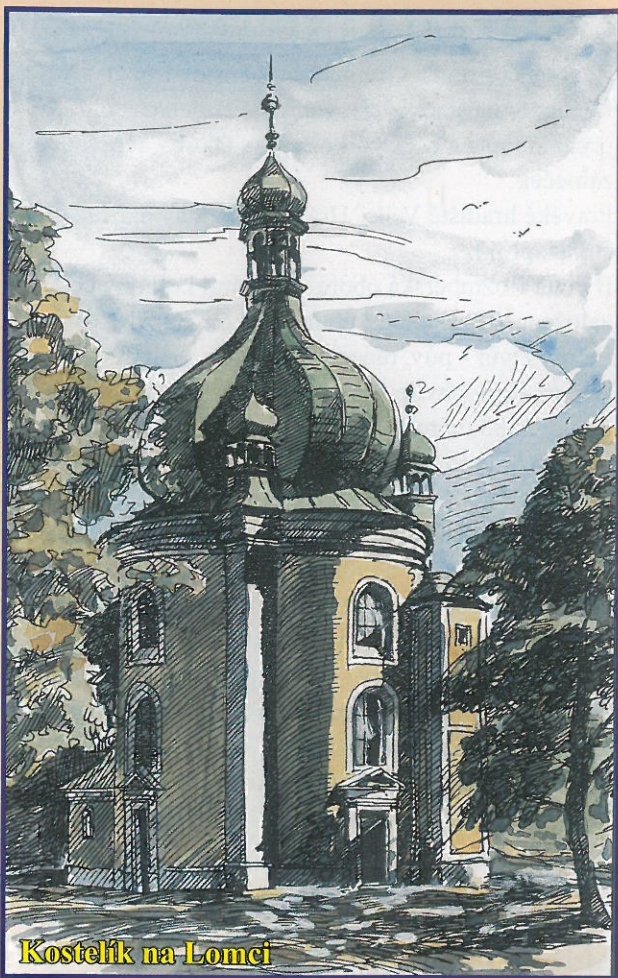
Kostelík na Lomci