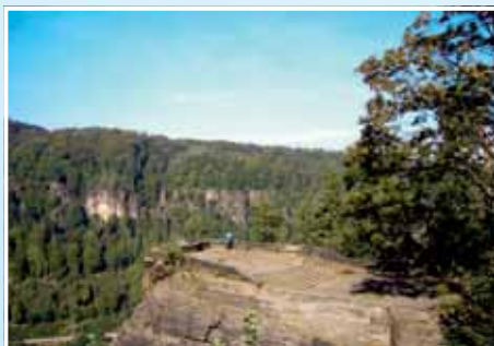
2. Belvédér – nejhezčí vyhlídka na České Švýcarsko