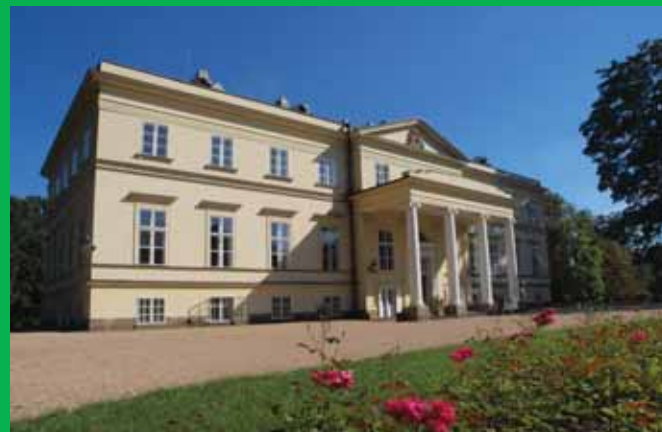
Kostelec nad Orlicí