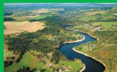
Divoká Orlice – Pastvinská přehrada