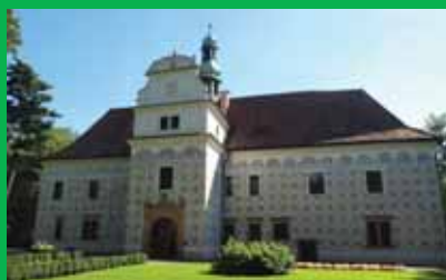
Doudleby nad Orlicí