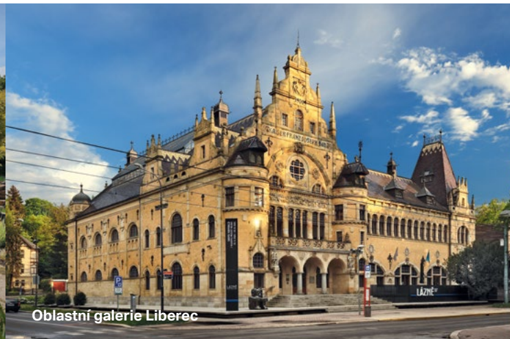
Oblastní galerie Liberec

a navštivte také zdejší 3D planetárium. Papilonia Liberec vás zase přenesou na dobrodružnou výpravu do nitra pralesa, kde mezi stovkami poletujících motýlů jako nezvaný host spočinulo havarované letadlo, dodávající tomuto motýlímu domu neopakovatelnou atmosféru.