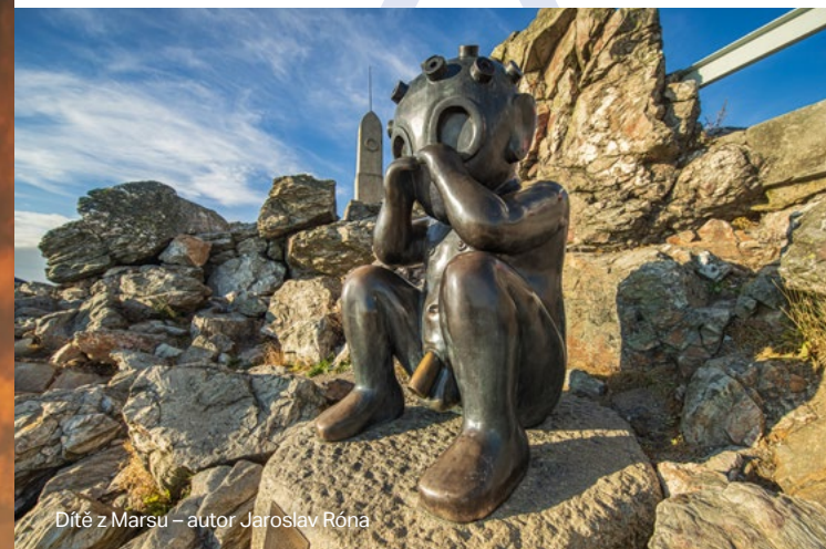
Dítě z Marsu – autor Jaroslav Róna