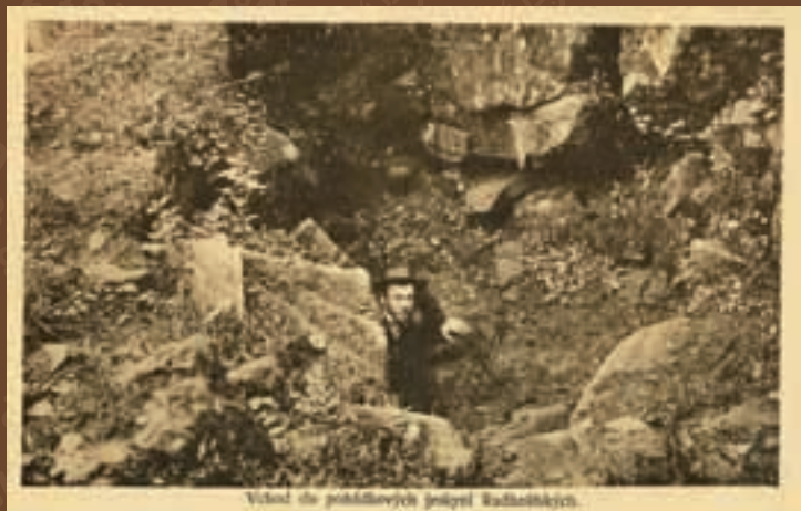
Vstup do podzemních jeskyní Kněhyně.

V CHKO Beskydy je registrováno 28 významnějších jeskyní. Mezi nimi vyniká jeskyně Cyrilka, která je s délkou 370 metrů nejdelší pseudokrasovou jeskyní u nás. Propast'ovitá Kněhyňská jeskyně je s hloubkou 57,5 m nejhlubší jeskyní tohoto typu v celých Západních Karpatech. JESKYNĚ NEJSOU VOLNĚ PŘÍSTUPNÉ.