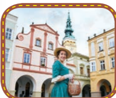
Historické perly Podbeskydí