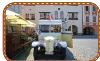
Technotrasa - Den pro klobouk