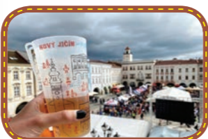
Pivobraní - červen