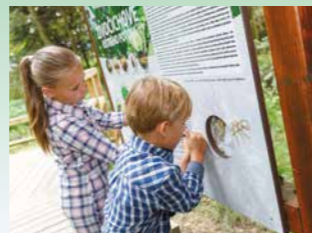
Živočiškové Ostrého potoka :)