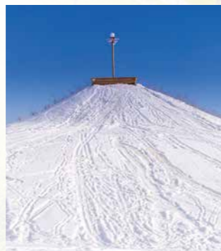
Nejvyšší bod ve městě – kopec Patriotů.