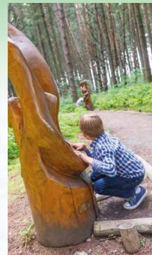
Vyřezaný podzemní telefon.