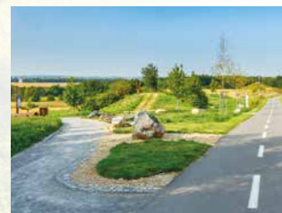
Geologická expozice v parku.

Park Patriotů je prostorově členěn za použití přírodních prvků. Čekají vás vysekané cestičky a lavičky k procházce, relaxaci a odpočinku a také piknikové prostory pro rodinné nebo přátelské grilování a opékání špekáčků v přírodě. Naleznete zde několik dřevěných laviček (tučňáci, zajíc, kůň, křeslo, šnek...). Součástí parku je geologická expozice hornin a nejvyšší hora ve městě – kopec Patriotů (543 m.n.m.).