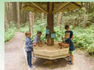
Razítka se stopami zvířat.