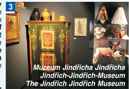
Muzeum Jindřicha Jindřicha Jindřich-Jindřich-Museum The Jindřich Jindřich Museum