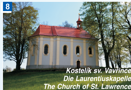
Kostelík sv. Vavřínce Die Laurentiuskapelle The Church of St. Lawrence