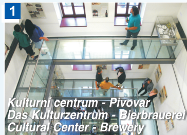
Kulturní centrum - Pivovar Das Kulturzentrum - Bierbrauerei Cultural Center - Brewery

Ve Hvozdu domažlického pivovaru je k vidění expozice o historii pivovarnictví v Domažlicích i v regionu. V roce 2020 se do dalších opravených částí pivovaru přestěhuje knihovna se vzdělávacím centrem, bude dokončeno komunitní centrum, klub, minipivovar, pivnice, restaurace. Na konci roku 2020 se pro návštěvníky otevře nová menší expozice v suterénu a v podkroví interaktivní výstava „Pozor hranice! Historie hrou“. Komenského 10, tel.: +420 379 725 852, www.idomazlice.cz