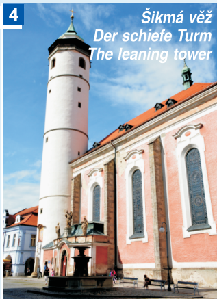
Šikmá věž Der schiefe Turm The leaning tower

Husova třída 61, tel. +420 379 722 974, www.muzeum-chodska.com