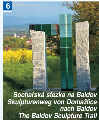
Sochařská stezka na Baldov Skulpturenweg von Domažlice nach Baldov The Baldov Sculpture Trail