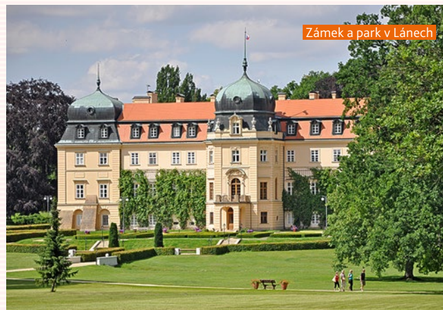
Zámek a park v Lánech

1. duben–31. říjen — st–čt 14–18; so, ne, svátky 10–18 www.hrad.cz