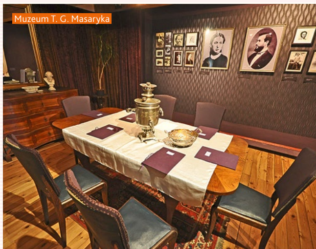
Muzeum T. G. Masaryka