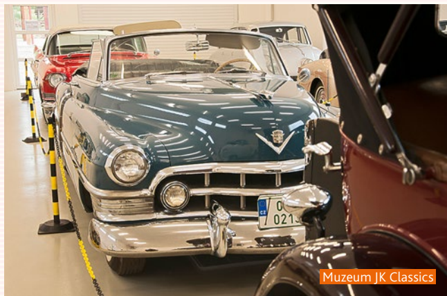
Muzeum JK Classics