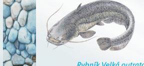
Rybník Velká outrata