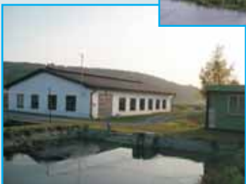
Budova rybí líhně