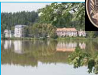
Škola a domov mládeže