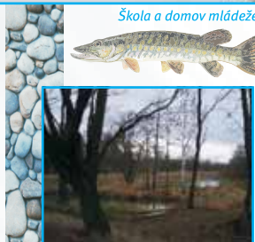
Tůně v korýtkách