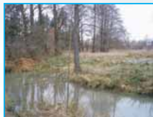
Tůně v korýtkách