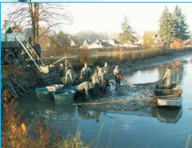
Výlov Malé Podvinice