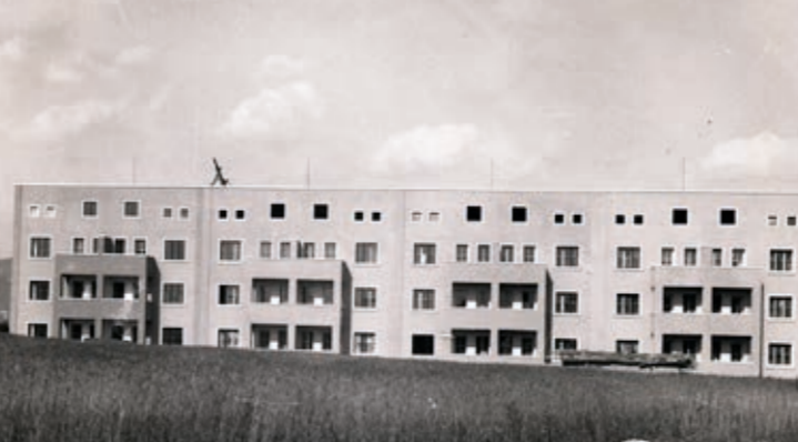
Komunální domy Typ 1927 na Klíši