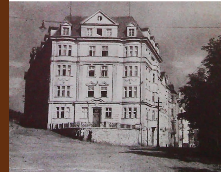
Blok D komunální výstavby z roku 1922