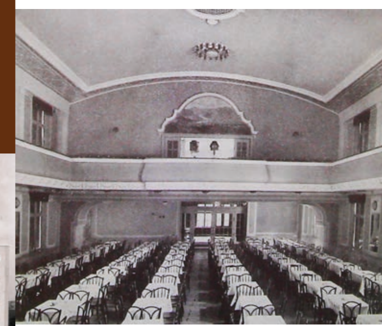
Vnitřní prostory Volkshaussäle, před rokem 1930