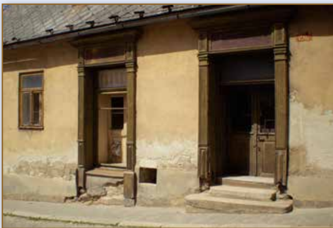
Toto je kadeřnictví, kam jezdila „Maryška“ (objekt bohužel chátrá ...)