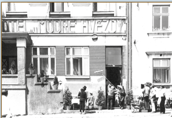
Hotel u Modré hvězdy při natáčení filmu