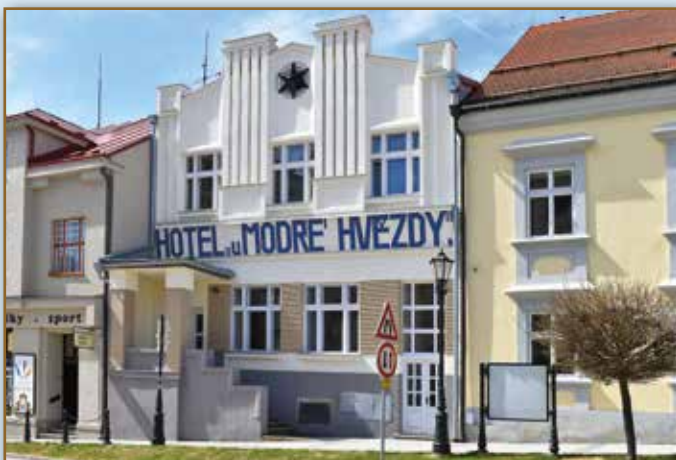
U tohoto hotelu pila „Maryška“ pivo

Toto byl jen úsek celého příběhu, který se odehrává také v našem překrásném městě.