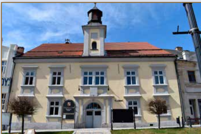
Radnice (vedle hotel u Modré hvězdy)