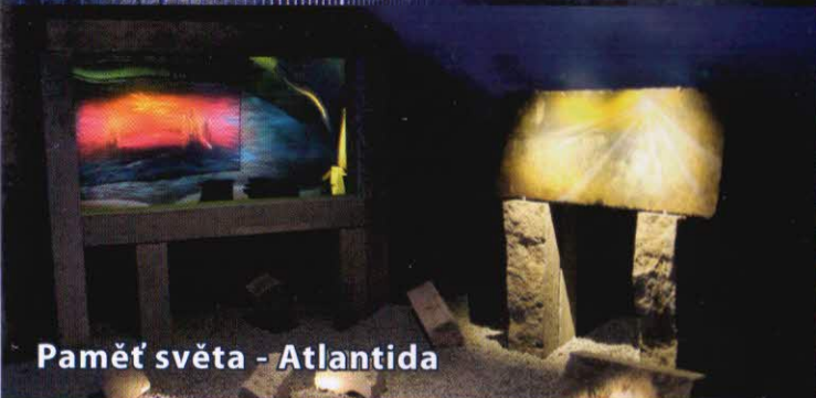
Paměť světa - Atlantida