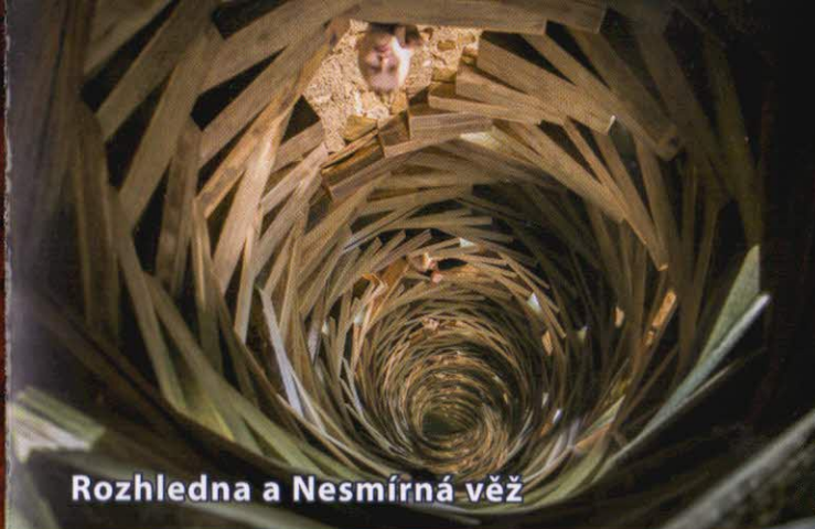
Rozhledna a Nesmírná věž

Tato prohlídková trasa se skládá z několika místností, kde mohou děti i dospělí zapomenout na vnější svět a mohou se nechat unést interaktivní hrou okamžiku.