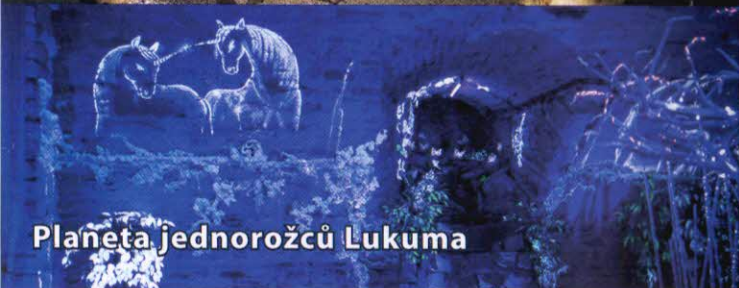
Planeta jednorozců Lukuma