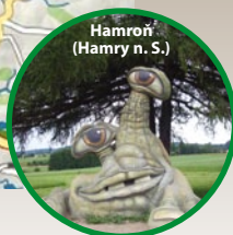
Hamroň (Hamry n. S.)