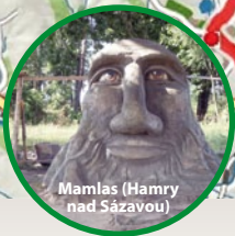
Mamias (Hamry nad Sázavou)