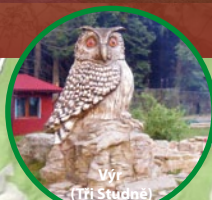
Výr (Tři Studně)