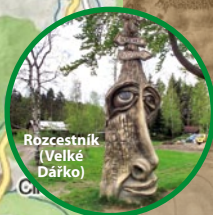
Rozcestník (Velké Dářko)