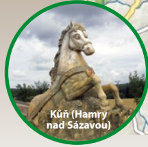
Kůň (Hamry nad Sázavou)