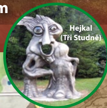
Hejkal (Tři Studně)