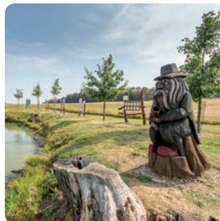
pohádková stezka Panenská