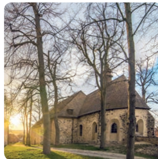
kostel sv. Víta + podzemní prostory