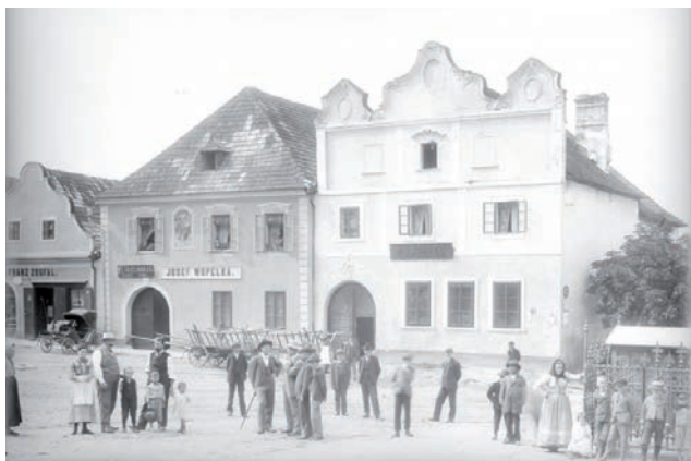
Österreichische Nationalbibliothek, Bildarchiv, autor August Stauda, 1902.