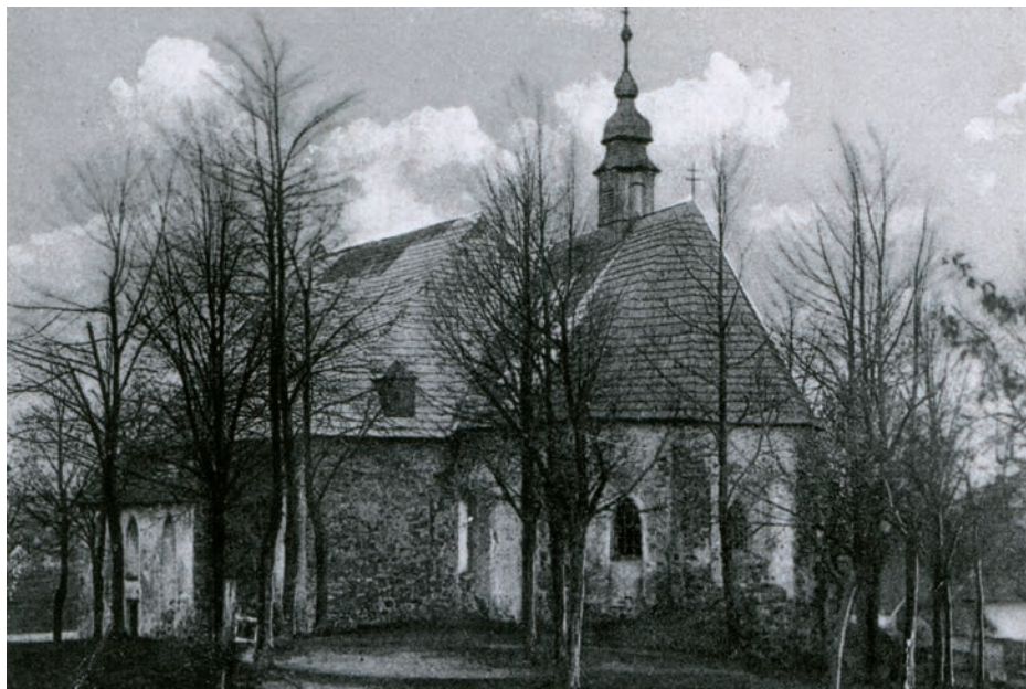
Archiv Vladimíra Hrbka, autor neznámý, 1918.