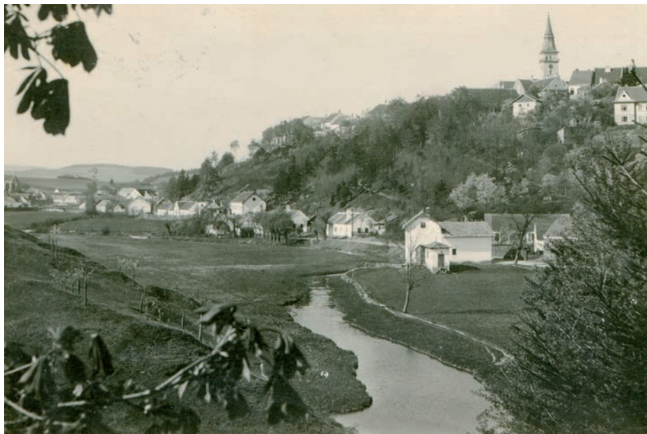
Archiv Vladimíra Hrbka, autor neznámý, 1935.