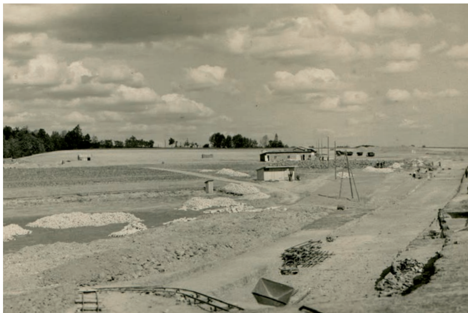
Archiv Vladimíra Hrbka, autor Bednář, 1947.