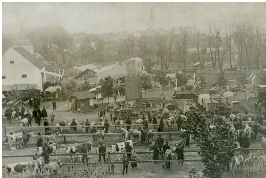
Archiv Vladimíra Hrbka, autor neznámý, 1914.