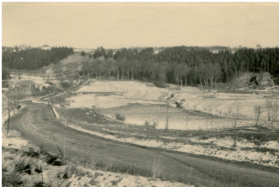
Archiv Vladimíra Hrbka, autor neznámý, 1898.