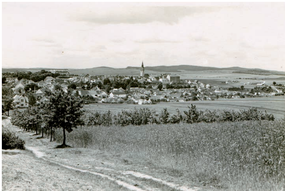
Archiv Vladimíra Hrbka, autor neznámý, 1939–1941.