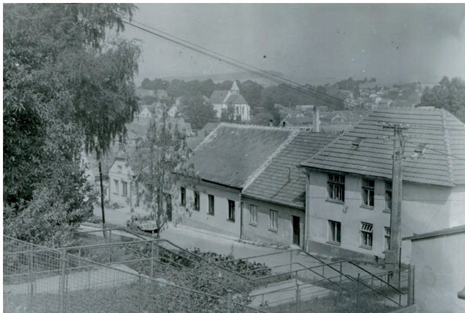
Vladimír Hrbek, 1988.