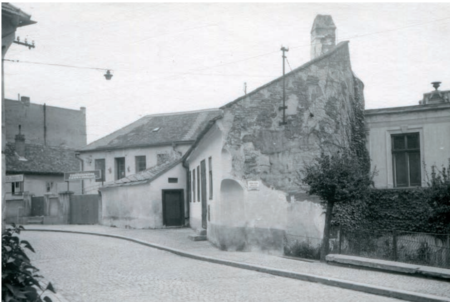
Archiv Vladimíra Hrbka, autor Fiedler, 1972.