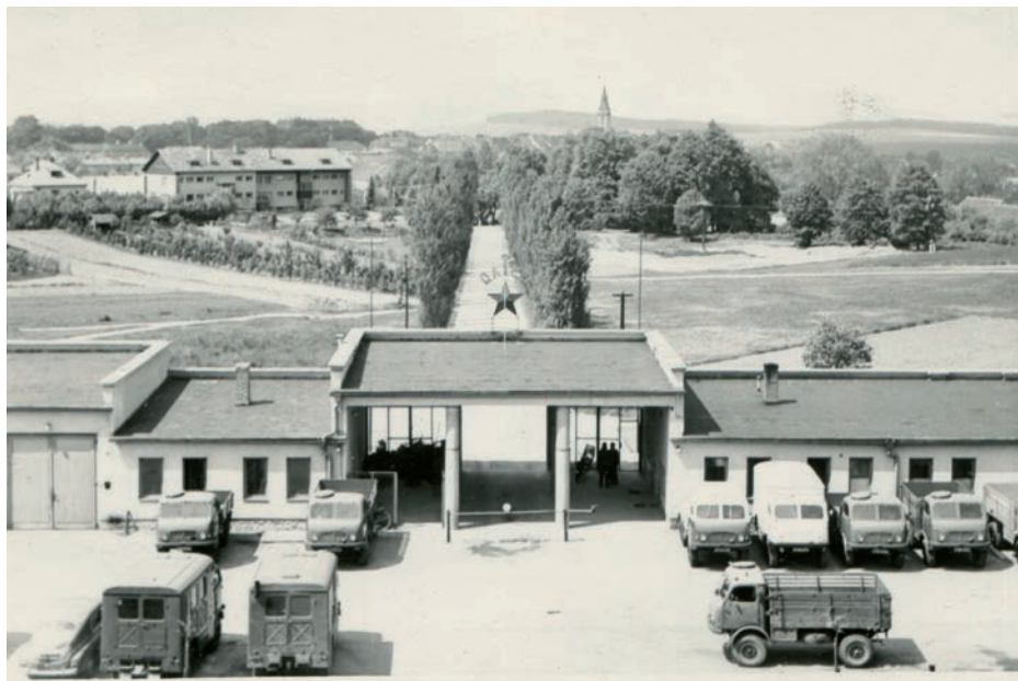
Archiv Vladimíra Hrbka, autor neznámý, 1958.