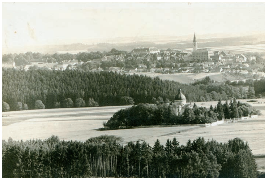
Archiv Vladimíra Hrbka, autor neznámý, 1940.