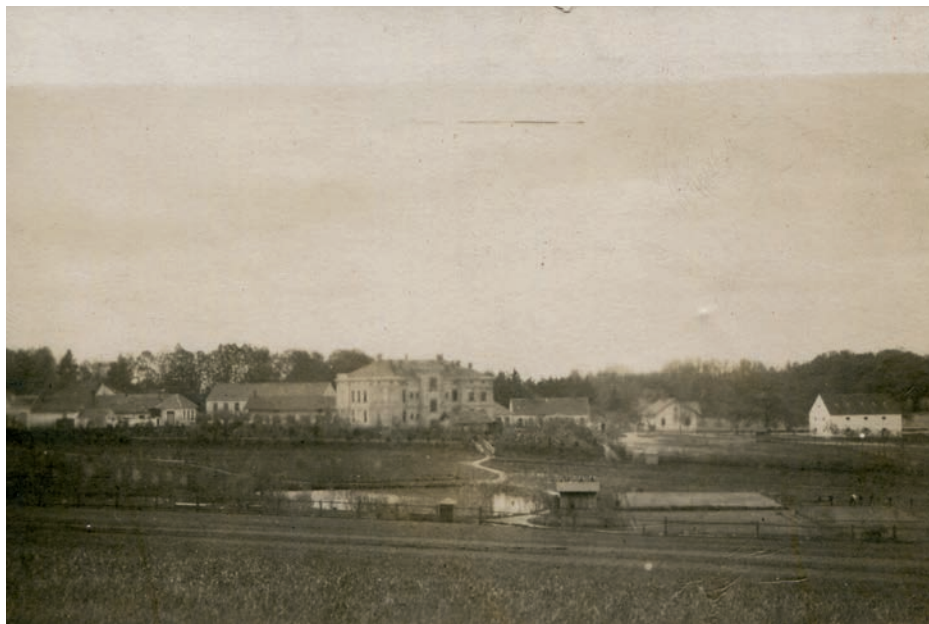
Archiv Vladimíra Hrbka, autor neznámý, 1908.