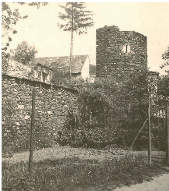
Archiv Vladimíra Hrbka, autor neznámý, pol. 20. století.