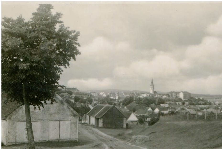
Archiv Vladimíra Hrbka, autor neznámý, 1930.