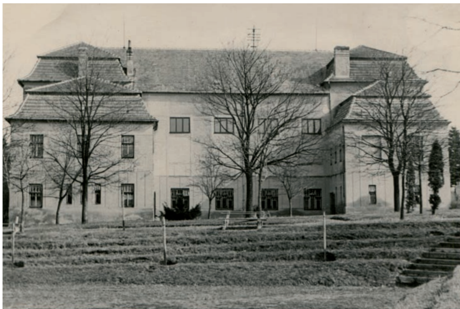
Archiv Vladimíra Hrbka, autor neznámý, 1948.