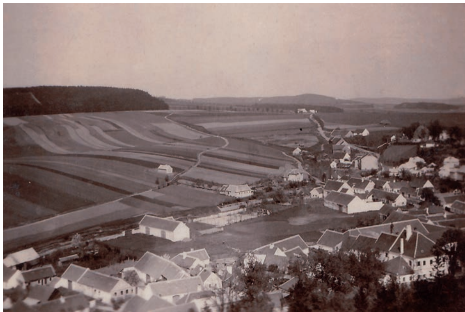
Archiv Vladimíra Hrbka, autor Slabý, 1935.