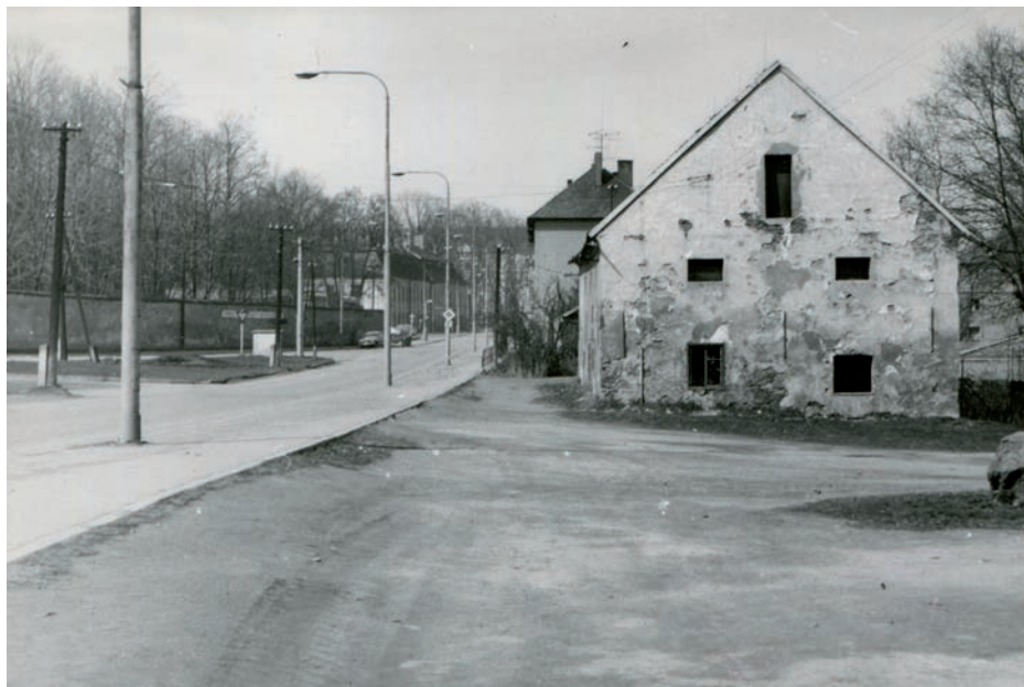
Vladimír Hrbek, 1980.