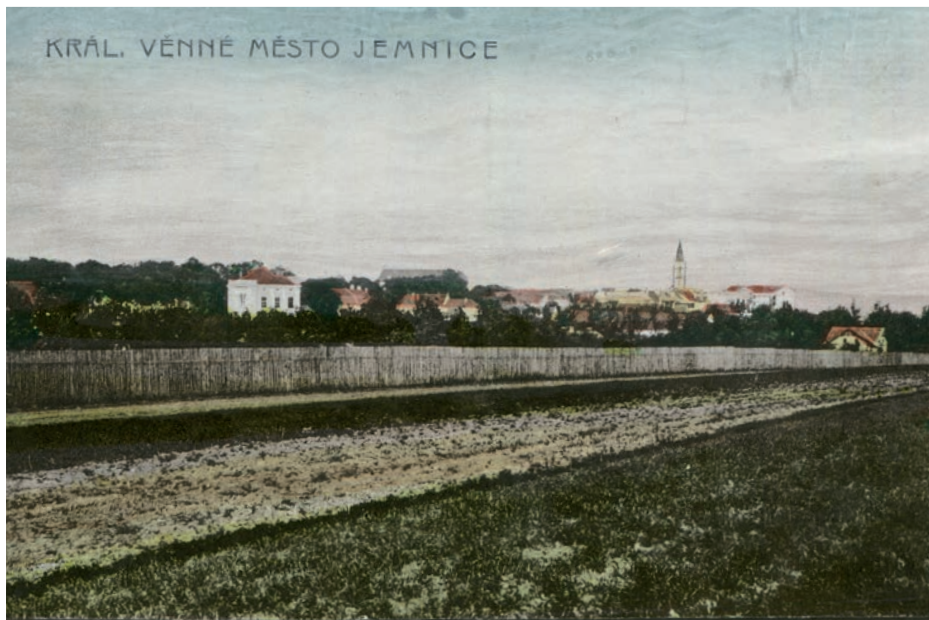
Archiv Vladimíra Hrbka, autor neznámý, 1910.