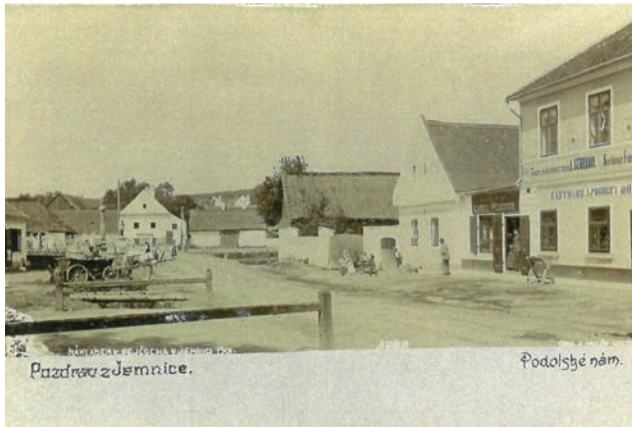
Archiv Vladimíra Hrbka, autor neznámý, 1901.