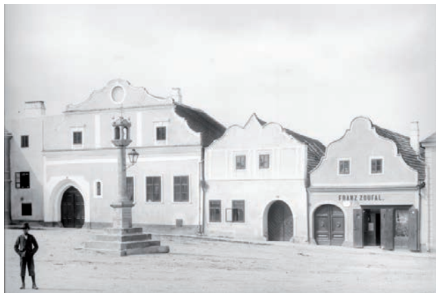
Österreichische Nationalbibliothek, Bildarchiv, autor August Stauda, 1902.