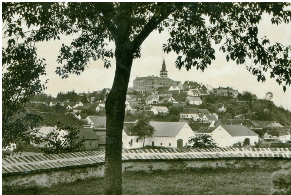
Archiv Vladimíra Hrbka, autor neznámý, 1937.