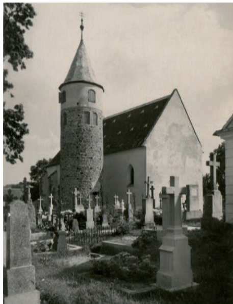
Archiv Vladimíra Hrbka, autor neznámý, 1955.