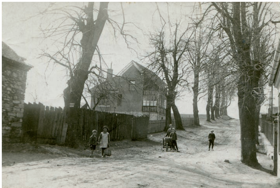
Archiv Vladimíra Hrbka, autor neznámý, 1931.