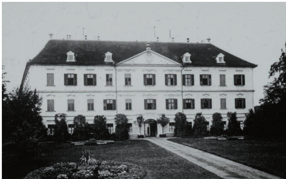
Bibliothek und Kunstblättersammlung, před rokem 1899.