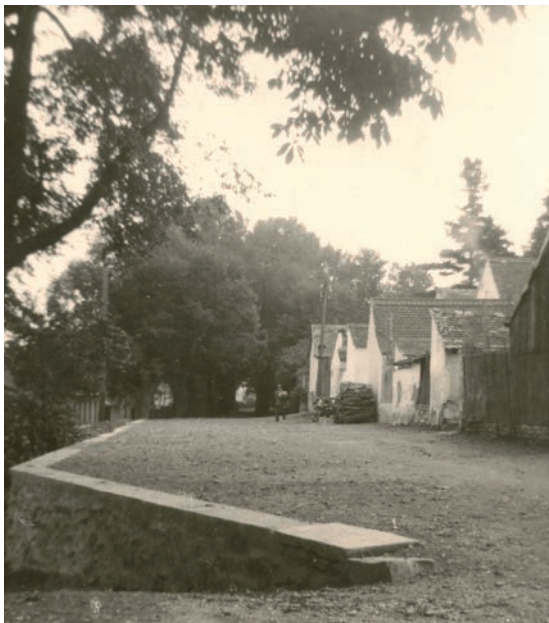
Archiv Vladimíra Hrbka, autor Račický, 1960.