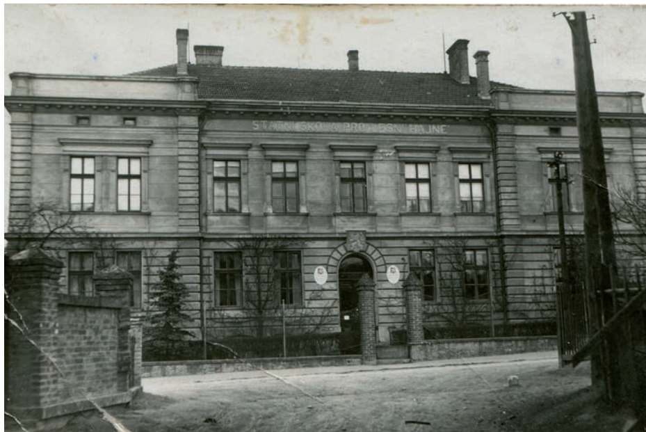
Archiv Vladimíra Hrbka, autor neznámý, 1933.