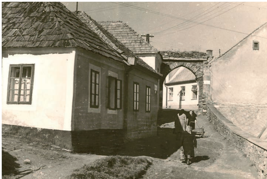
Archiv Vladimíra Hrbka, autor neznámý, 1964.