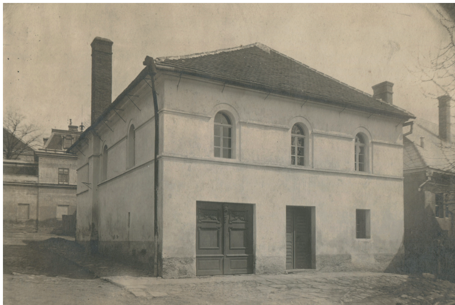
Archiv Vladimíra Hrbka, autor neznámý, počátek 20. století.