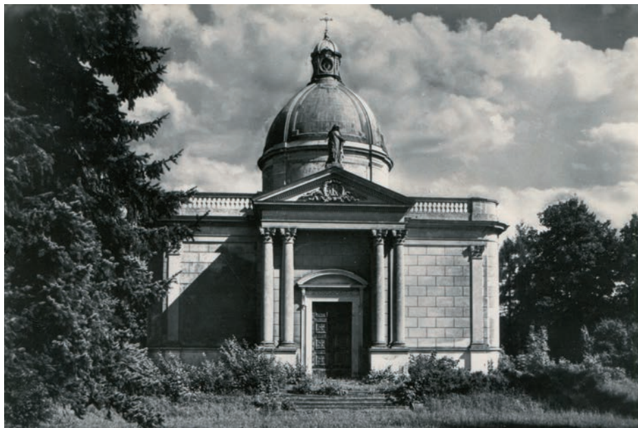
Archiv Vladimíra Hrbka, autor neznámý, 1965.