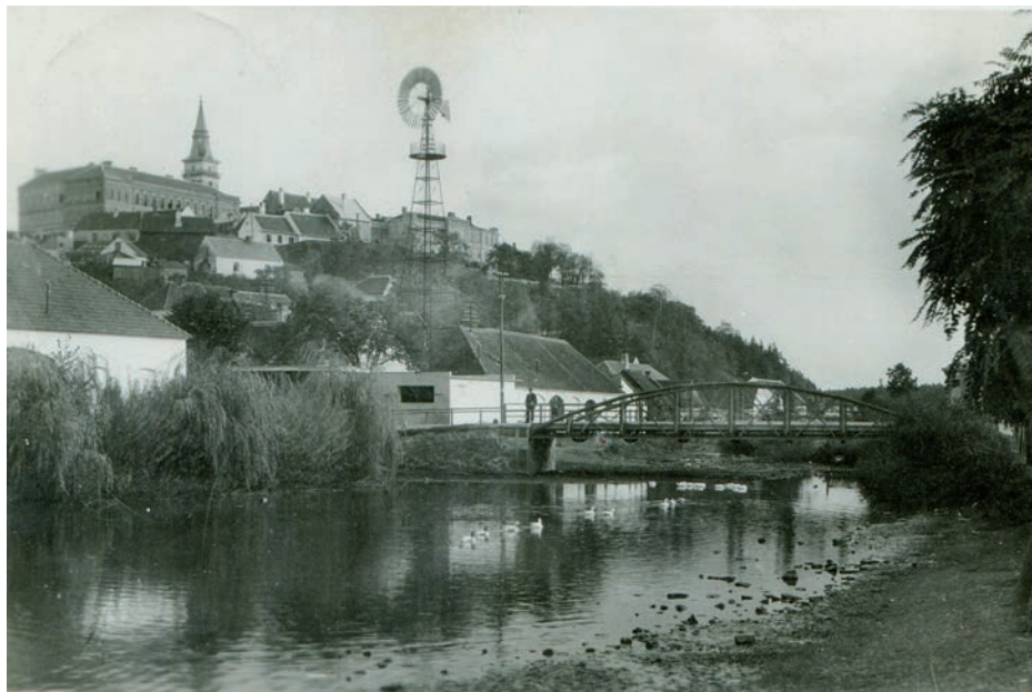
Archiv Vladimíra Hrbka, autor neznámý, 1938.