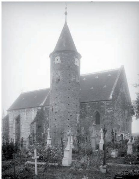
Österreichische Nationalbibliothek, Bildarchiv, autor August Stauda, 1902.