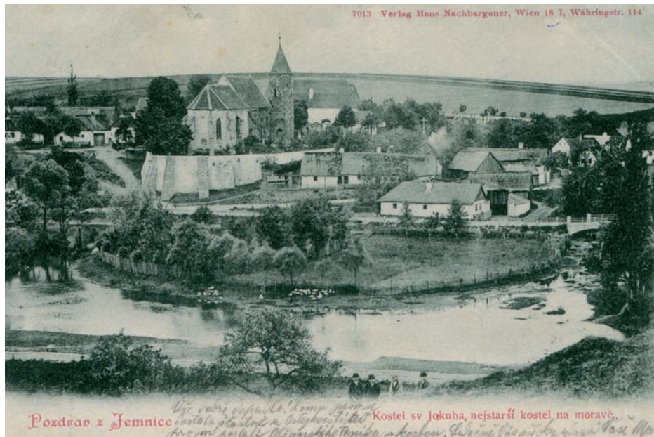
Archiv Vladimíra Hrbka, autor neznámý, 1898.