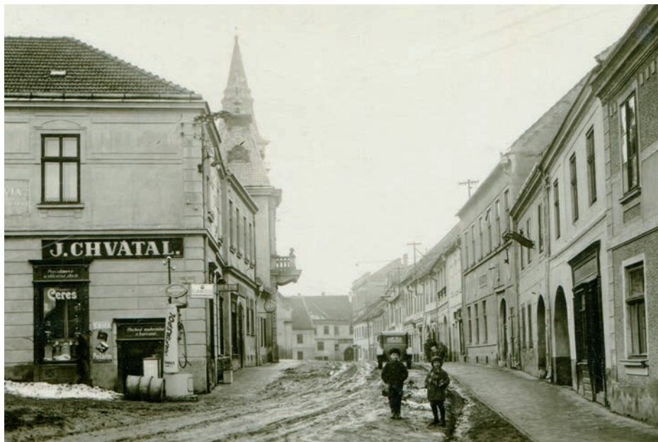
Archiv Vladimíra Hrbka, autor neznámý, 1932.