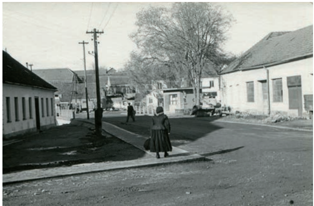
Archiv Vladimíra Hrbka, autor neznámý, 1962.