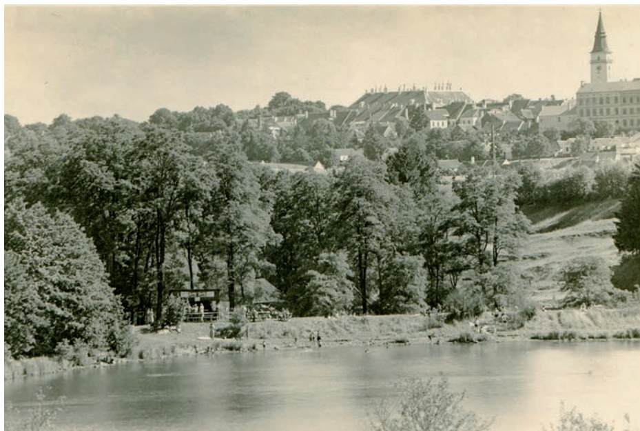
Archiv Vladimíra Hrbka, autor neznámý, 1938.