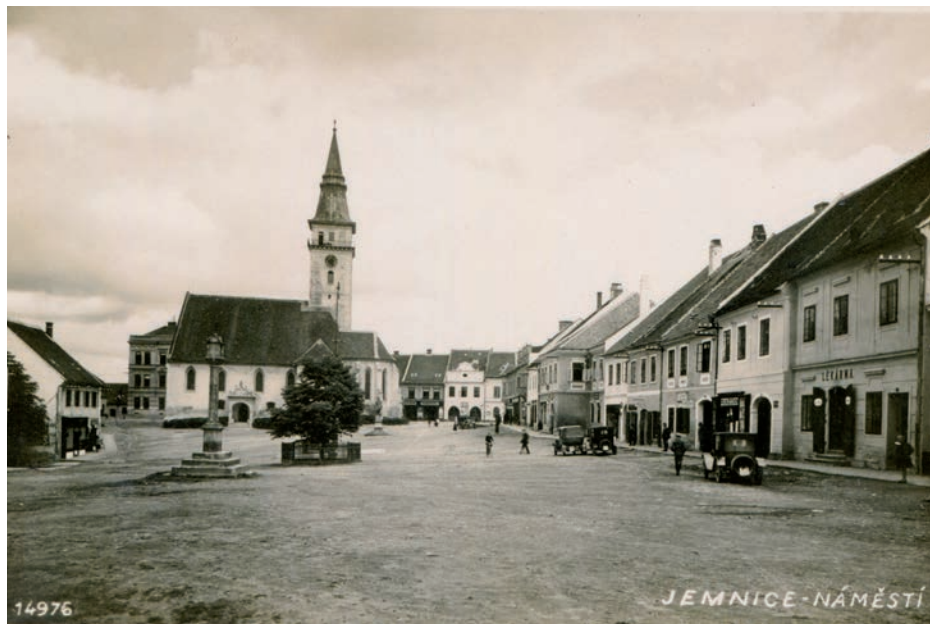
Archiv Vladimíra Hrbka, autor neznámý, 1930.