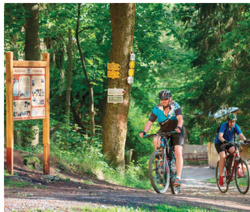
U zříceniny hradu Vízmburk