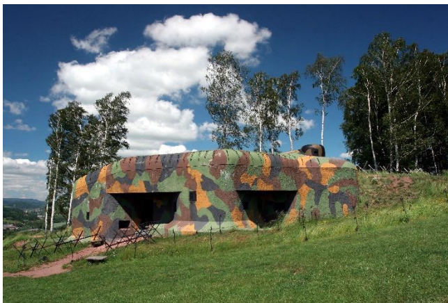
Pěchotní srub N-S 82 Březinka