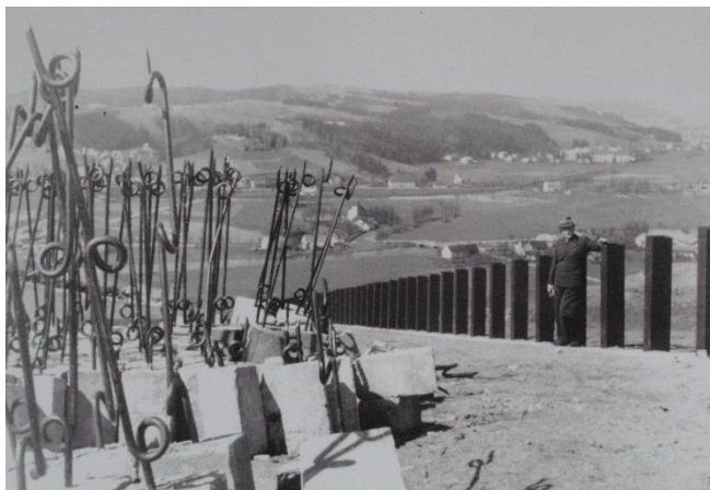
Překážky pod srubem Březinka (rok 1938)

30. září 1938 však byla podepsána Mnichovská dohoda, kterou bylo evropskými mocnostmi Československu nařízeno postoupit pohraničí, obývané převážně sudetskými Němci. Československá vláda, zrazená spojenci – Francií a Velkou Británií, byla přinucena v zájmu „záchrany míru v Evropě“ s mnichovským diktátem souhlasit a vzdát se pohraničního území i s pevnostmi ve prospěch Německa. Z tohoto důvodu nebyl pevnostní systém nikdy uveden do chodu.