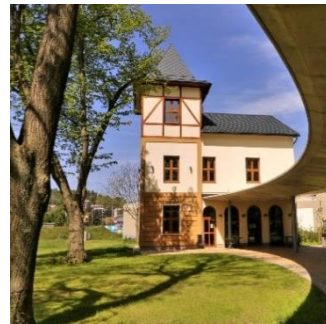
Malé lázně Běloves