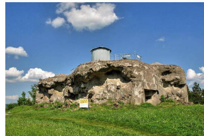
Dělostřelecká tvrz Dobrošov

Dělostřeleckou tvrz Dobrošov naleznete na okraji stejnojmenné obce. V letech 2019–2021 prochází celkovou rekonstrukcí, po jejímž dokončení bude opět přístupná návštěvníkům. Součástí prohlídkové trasy jsou dva vojenské sruby a část podzemních chodeb. V nových prostorách návštěvnického centra najdete úvodní expozici přibližující historii opevnění, jejíž součástí je i soubor miniatur vojáků. Další část tvoří interaktivní expozice a promítací sál. Naprostou novinkou je využití moderních technologií v podobě dotykového stolu s možností „osahat“ si zbraně československé armády nebo projekce o netopýrech, kteří v pevnosti zimují, prostřednictvím 3D brýlí.