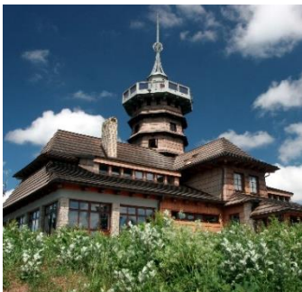
Jiráskova chata Dobrošov

Jiráskova chata na Dobrošově je jedním z nejvyhledávanějších turistických cílů v okolí Náchoda. Pojmenována byla po spisovatelci Aloisi Jiráskovi, slavném rodákovi z nedalekého Hronova. Původní útulna KČT tu byla postavena již v roce 1896. Brzy svou kapacitou přestala stačit rostoucí návštěvnosti, ale plány na stavbu nové chaty oddálila 1. světová válka. Stavba nové chaty podle plánů slovenského architekta Dušana Jurkoviče byla zahájena v květnu 1923 a již 28. září 1923 byla otevřena. V současnosti je kulturní památkou a stále slouží potřebám turistů. Více najdete na www.jiraskovachata.cz .