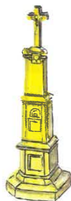
7 Památník zasnoubení

Pískovcový památník z roku 1854 najdete vedle polní cesty nad nelahozeveským hřbitovem. Vznikl jako památka zasnoubení císaře Františka Josefa I. s princeznou Alžbětou Bavorskou, kterou všichni známe jako Sisi. Na památníku stojí napsáno: "Na den slavného a radostného zasnoubení našeho nejmilostivějšího císaře Pána a pana Františka Josefa I. s nejosvícenější princeznou Alžbětou, Arcivévodkyní Bavorskou dne 24ho dubna 1854 na věčnou památku od malých dětí školy Nelahozeveské."