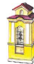
6 Kaplička sv. Jana

Barokní kaplička sv. Jana z 18. století se nachází na okraji Lešan, které jsou součástí obce Nelahozeves. Je umístěna na výrazném návrší ve stínu památné lípy, odkud je krásný výhled na horu Říp a České středohoří. V těsné blízkosti se nachází starý sad zvaný Višňovka, o který se stará spolek Lešanský sad. Kaplička byla v roce 2019 opravena a vysvěcena, do výklenku byla vrácena soška sv. Jana Nepomuckého. Je součástí žluté turistické cesty na trase mezi královským městem Velvary a Kralupy n. Vltavou.