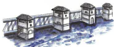
4 Vodní dílo Miřejovice

Jez, most, plavební komory a vodní elektrárna postavené na začátku 20. století nabízejí úchvatnou podívanou. Most pro pěší a cyklisty propojuje Nelahozeves a Veltrusy. Atraktivní lokalitu využívají často filmaři, a tak jste most mohli vidět v mnoha českých i zahraničních produkcích.