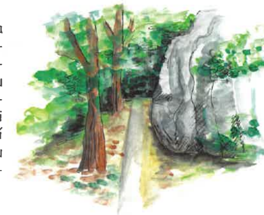
9 Dvořákova stezka

Tato odpočinková cesta podél Vltavy a železničního koridoru propojuje Kralupy nad Vltavou a Nelahozeves. Je lemována vzácnými pískovcovými útvary, které připomínají skalní město. Ve skále jsou raženy 3 tunely z první poloviny 19. století.