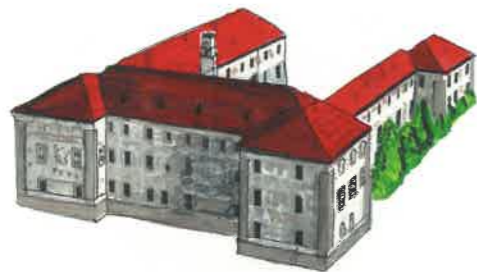
1 Zámek Nelahozeves

Jeden z nejkrásnějších renesančních zámků v majetku rodiny Lobkowiczů majestátně vyhlíží daleko do okolí. Veřejnosti nabízí prohlídky zámku, programy pro děti a navštívit lze i dětské hřiště s občerstvením „Na skále“. Součástí stálé expozice jsou mimo jiné vzácné obrazy Jana Brueghela st., Petera Paula Rubense a Paola Veroneseho. Na zámku se také konají oblíbené trhy a festivaly.