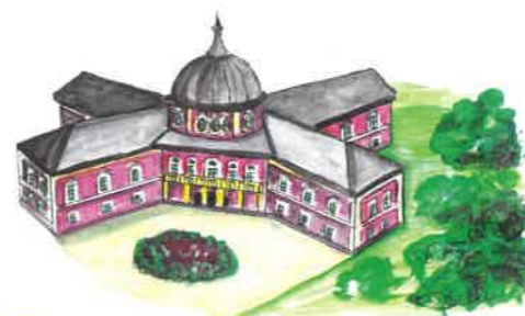
8 Státní zámek a park Veltrusy

Tento romantický zámek obklopený rozsáhlým parkem patří k perlám barokního stavitelství ve Středočeském kraji. V areálu se nachází mnoho originálních staveb, pavilonů, a dokonce egyptská sfinga. Zámek nabízí mimo jiné i prohlídky na kole nebo z koňského povozu. Součástí zámku je také vzdělávací centrum Schola naturalis.