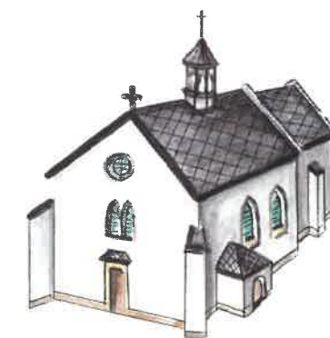
3 Kostel sv. Ondřeje

Malebný kostelík z první poloviny 14. století je nedílnou součástí života obce. V barokní křtitelnici byl pokřtěn novorozený Dvořák, jako dítě sem chodil na bohoslužby, konala se zde jeho první veřejná vystoupení na housle za doprovodu varhan. V dřevěné zvonici se nacházely dva zvony, které ale byly odcizeny. V roce 2021 přešel kostel do majetku obce a připravuje se jeho rozsáhlá rekonstrukce.