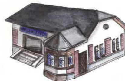
5 Turistické informační centrum

Bývalé nádraží z roku 1925 slouží nově jako infocentrum obce Nelahozeves. U dobré kávy načerpáte inspiraci k výletu a dozvíte se víc o slavném rodáku Antonínu Dvořákově. Děti mohou pozorovat vláčky, cyklisté dobít elektrokolo a turisté energii.