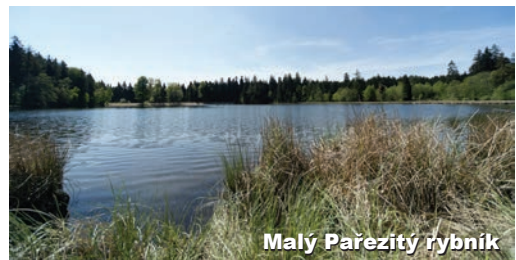
Malý Pařezitý rybník