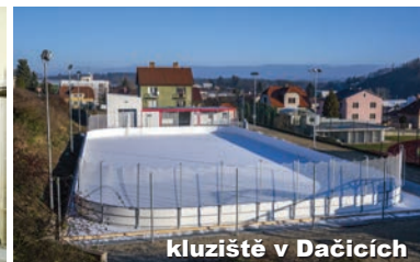
kluziště v Dačicích