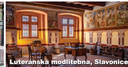
Luteránská modlitebna, Slavonice