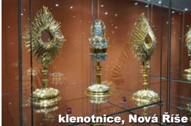
klenotnice, Nová Říše