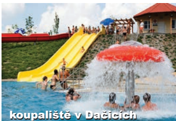
koupaliště v Dačicích