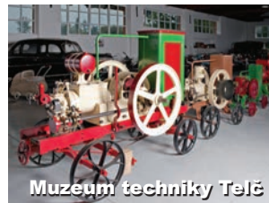
Muzeum techniky Telč