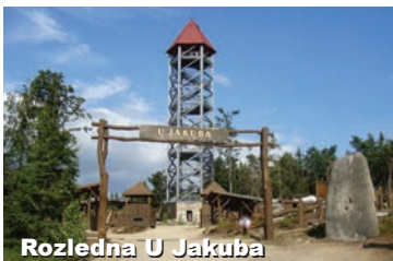
Rozhledna U Jakuba